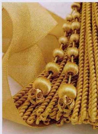
Passementeries de la collection « Les Ors », entièrement fabriquées à la main, prix sur devis, créations Jérôme Declercq pour Declercq Passementiers.

Un prestigieux canapé quatre places « Chevigny Louis XV ». H 107 x L 240 x P 85 cm, à partir de 11 085 € selon le revêtement, Taillardat .