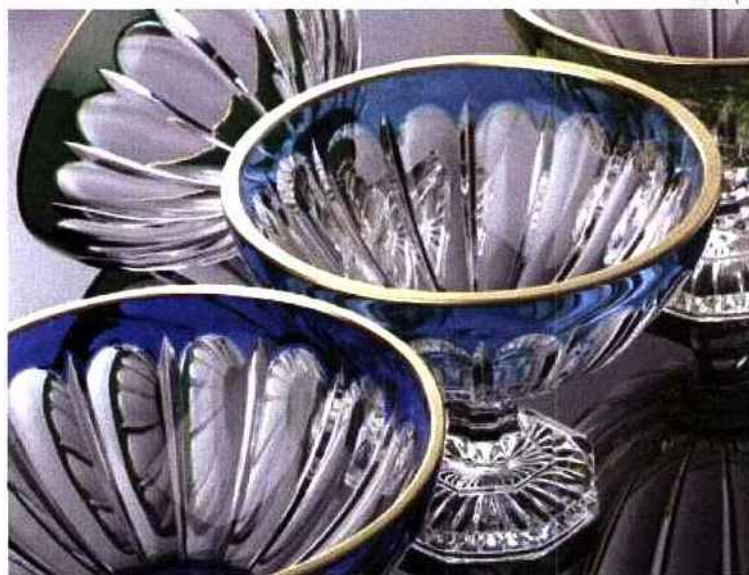
Cristallerie de Montbronn