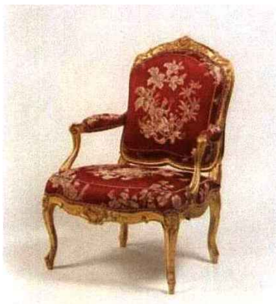
Henryot & Pozzoli

La société est aujourd'hui labellisée "Entreprise du Patrimoine Vivant".