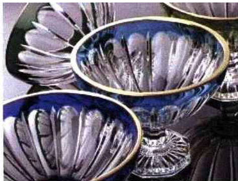
Cristallerie de Montbronn

Menuiserie, faïencerie, orfèvrerie, marbrerie décorative, confection de linge de maison... Partez à la découverte de la richesse artisanale et artistique de la Lorraine. Notre guide ? L'association "Terre de luxe" qui regroupe vingt entreprises autour d'un projet commun : le développement de la région par les métiers d'art et du luxe.