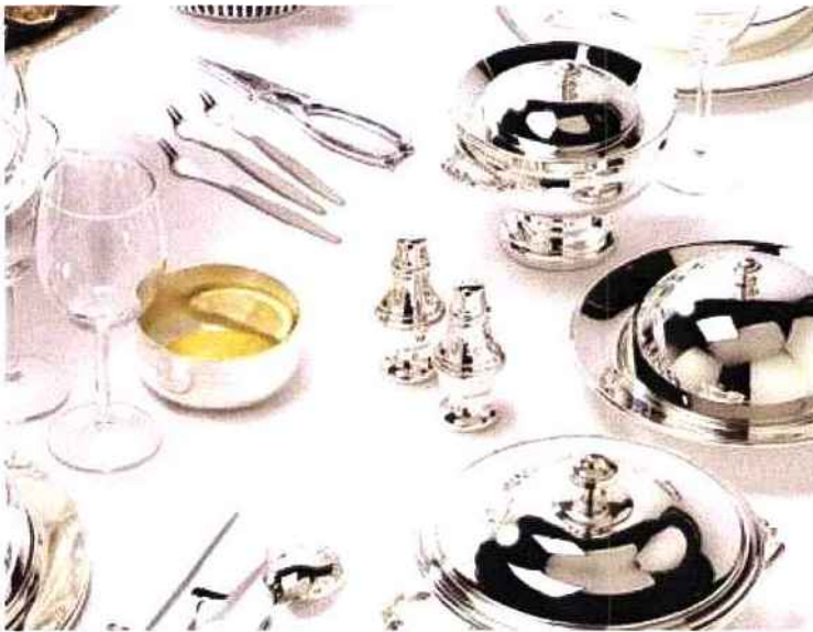
Couverts de Mouroux