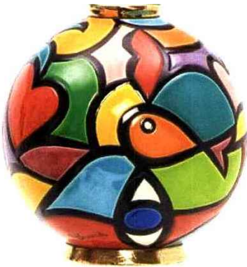
Faïenceries et Emaux de Longwy

C'est une entreprise labellisée "Entreprise du Patrimoine Vivant".