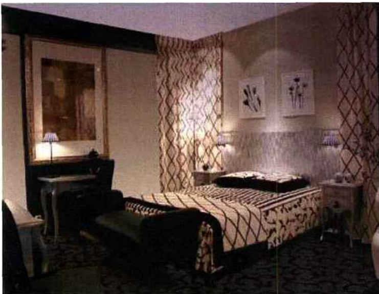
Collinet Sièges ®