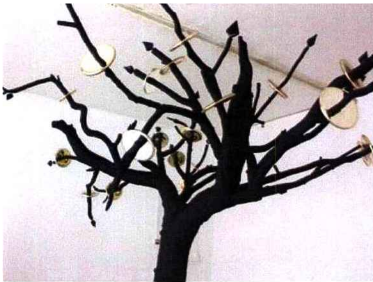
MHD La licorne Verte ©